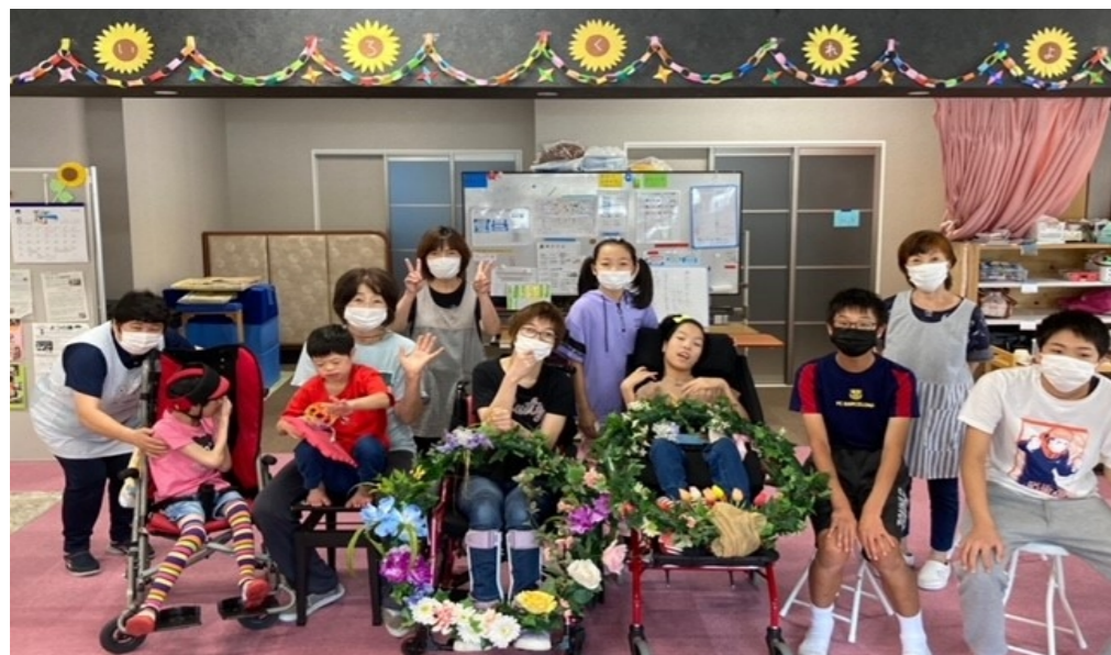
カラオケ交流会 好きな歌を歌ったよ

土曜日に届けてもらいました。ぱあるのみなさんで受け取りました。階段にかけてもらって華やかになりました🌸